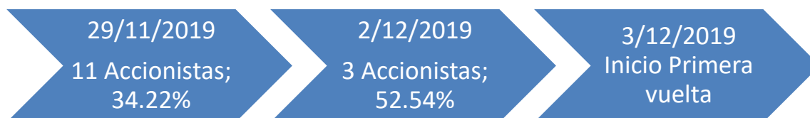
Gráfico No. 1. Fechas de recibo de la comunicación del reglamento por parte de algunos accionistas que representan el 86.76% de participación.

Cfr: hechos 31 al 35. (fls. 162 al 250 del Cuaderno 7 y fls. 1 al 69 del Cuaderno 8)